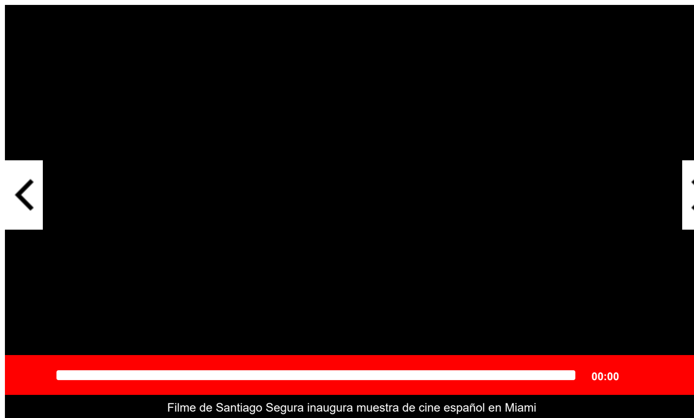
Filme de Santiago Segura inaugura muestra de cine español en Miami