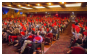
Asistentes a una proyección del Recent Cinema From Spain de Miami en 2015.

La nación más poderosa del mundo lo es también en el cine. Salvo un puñado de resistentes (Japón, India, Corea del Sur o China), las películas de Estados Unidos son las más vistas en la mayoría de los países del planeta. Y, claro, en su propio territorio. Prácticamente nueve de cada 10 espectadores en EE UU acudieron a ver un filme nacional en 2015, según el Observatorio